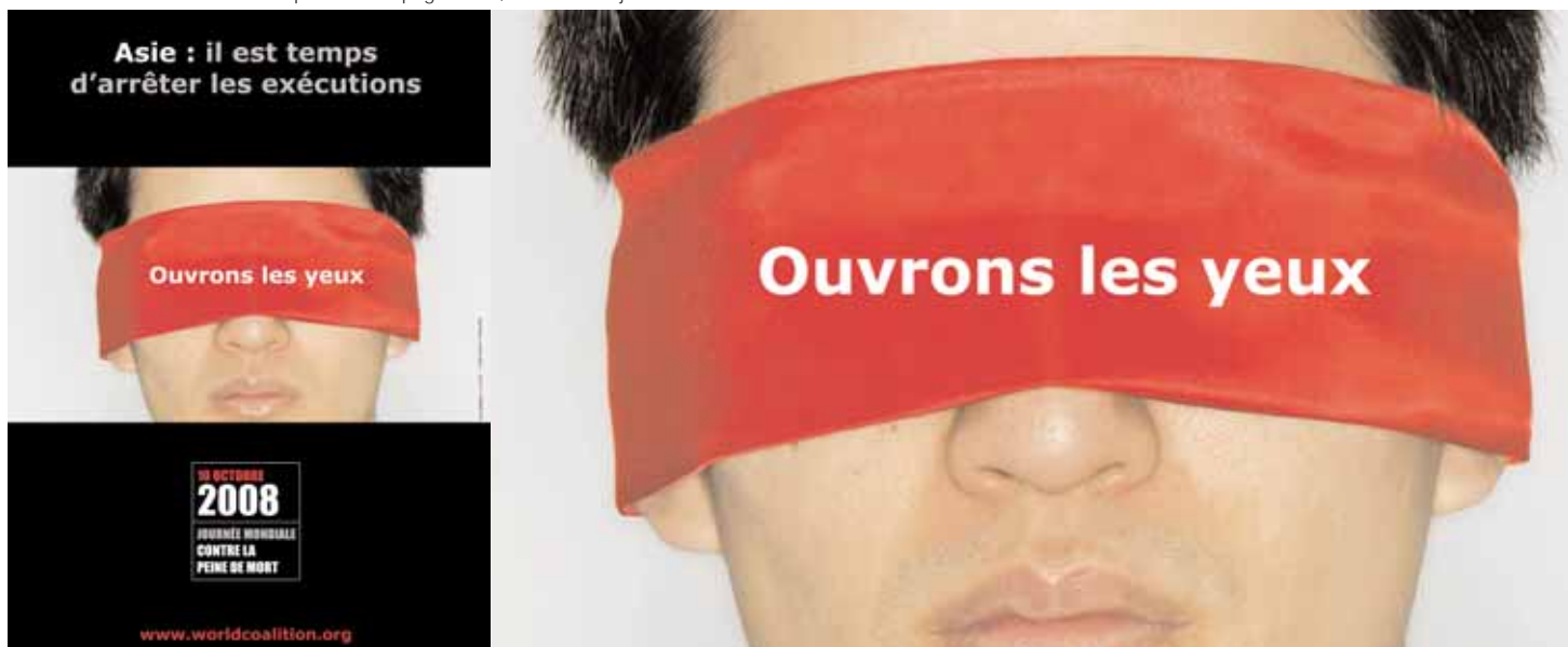
Affiches diffusées mondialement pour la Campagne Asie, thème de la journée mondiale 2008

Cette mission faisait écho à celle organisée à Taïwan, autre pays cible de la Journée mondiale, en juin 2008 ou une dél-