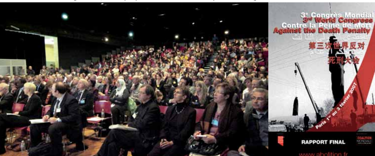
L'affiche du 3 e Congrès mondial, et la salle principale de la Cité universitaire de Paris qui a accueilli le congrès.

Deux missions ont déjà été effectuées en Suisse pour prendre des contacts avec l'ensemble des partenaires mobilisés/mobilisables pour l'organisation du 4e Congrès mondial et la levée de fonds. Ces missions ont permis de formaliser le partenariat avec la Confédération suisse qui soutient largement le Congrès ; d'identifier le lieu de la tenue de l'événement ; et enfin de mobiliser les partenaires. ECPM prospecte pour un soutien politique et financier, logistique et bénévole, pour un soutien en communication ainsi que pour la programmation scientifique et culturelle.