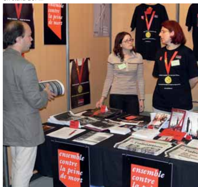
Un stand ECPM