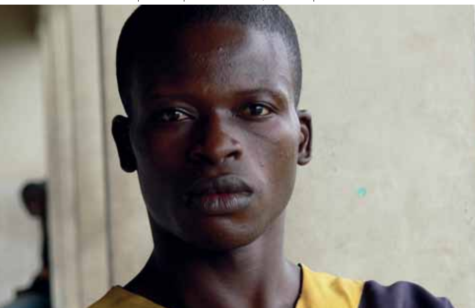
Un détenu à temps dans la prison de Kinshasa, RDC

Il est difficile d'établir une évaluation du nombre de correspondants en lien avec les condamnés car le suivi serait trop coûteux. ECPM a cependant mené en 2008, un travail de recensement et d'évaluation des besoins des condamnés à mort américains. Au cœur des attentes, la recherche de correspondants permettant aux condamnés de rompre leur isolement et de trouver soutien et réconfort. Aux États-Unis, les condamnés ont désormais pris l'habitude de nous écrire directement pour nous faire part de leurs besoins, et transmettent notre adresse à leurs compagnons de cellule.